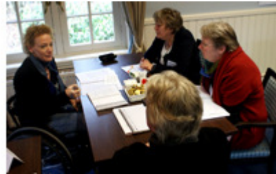
Een basistraining voor teamleden

Trainingen van Perspectief zijn praktisch en doelgericht en brengen een heldere maatschappijvisie over. Uitgangspunt is dat de bijdrage van iedereen nodig is om te werken aan verbetering en dat ieder mens kwaliteiten heeft. Mensen worden in de activiteiten van Perspectief Trainingen uitgenodigd deze verder te ontwikkelen en de eigen kracht te ervaren.