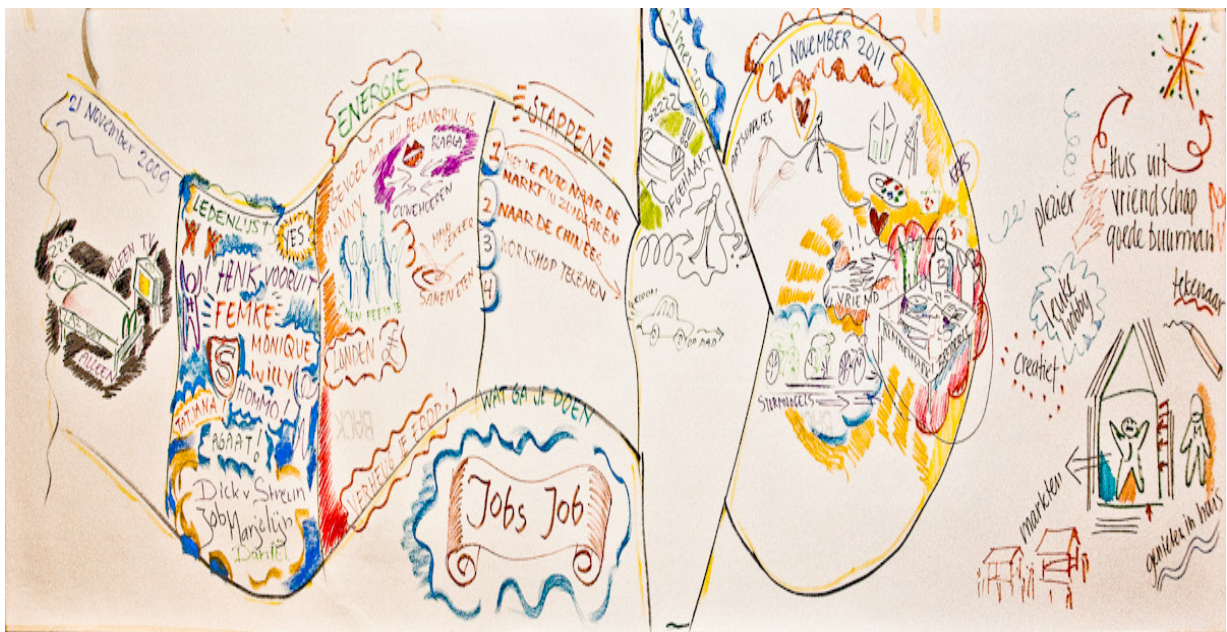
Een getekend toekomstplan van een jongeman met beperking. Hij wil geen "zorg", maar werk en vriendschappen.

Bovendien is zorg slechts een onderdeel van het leven van mensen want ook onderwijs, arbeid, vriendschappen, vrijetijdsbesteding en vervoer zijn van groot belang. De evaluaties van Perspectief zijn gericht op de verbeteringen die in het leven van mensen zelf zijn te bewerkstelligen vanuit een brede kijk op en kwalitatief goed bestaan. Formeel heeft Perspectief geen middel in handen om verbeteringen af te dwingen, maar als Perspectief niet meer wordt ingeschakeld voor evaluaties, dan kunnen schrijnende situaties de overhand krijgen.