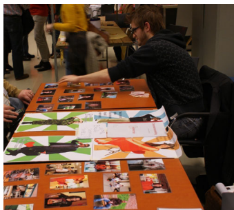
Het spel over beeldvorming

Zo ontwikkelden studenten van de Hogeschool Arnhem/Nijmegen in opdracht van Perspectief verschillende spelvormen over beeldvorming. De spelvormen zijn uitnodigend, niet belerend en zorgen voor geanimeerde gesprekken over de eerste indruk die we ons van iemand vormen en wat dat voor effect heeft op je gedrag. Waarom vraag je aan de één wel de weg en aan de ander niet? Welke verwachtingen hebben we van iemand op basis van een enkele blik? Negatieve beeldvorming wordt vaak niet uitgesproken maar heeft ondanks dat wel grote gevolgen voor de persoon die het betreft. Deze spelen maken deelnemers alert op het onderwerp en brengen op een leuke manier een gesprek op gang.