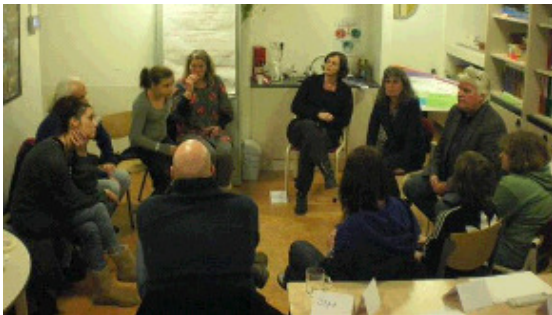
Een netwerkbijeenkomst in het kader van IkLeerOok.

Gaandeweg blijkt het netwerk belangrijk voor deelnemers aan het project. Veel ouders met een kind met een beperking voelen dat ze alleen voor ingewikkelde stappen en beslissingen staan. Zelf een netwerk bijeenroepen is emotioneel moeilijk. Ouders willen ondersteuning bij het organiseren van een netwerk dat met hen meedenkt en doet. IkLeerOok geeft die ondersteuning. Bij meer dan de helft van de gezinnen die aan het project meedoen zijn één of meer bijeenkomsten geweest. Ieder gezin heeft dat op een eigen wijze ingevuld. De grootte van een netwerkgroep varieert tussen de zes en 25 mensen. Sommige netwerken bestaan vooral uit vrienden en familie, andere voornamelijk uit professionals en weer anderen uit een combinatie hiervan.