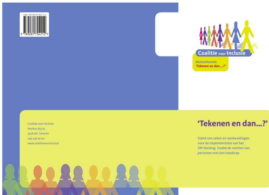
Publicatie over het VN-Verdrag

Nederland na ratificatie. Ook is uitgebreid gepubliceerd op de website www.coalitievoorinclusie.nl en www.vnverdragwaarmaken.nl .